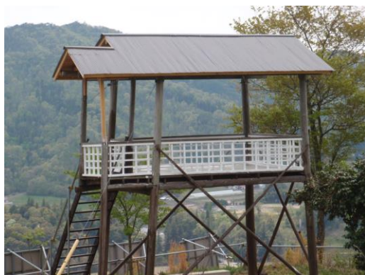
「見晴しやぐら」に屋根が できました

昨年度は、やぐらの補修、登山歩道、ベンチや階段の整備、小田城由来の看板、案内板を設置しております。この事業は、平成25年度から4年間、県の「ひろしま森づくり事業」(特認事業)により整備を行ってまいります。 皆様のご協力をお願いします。