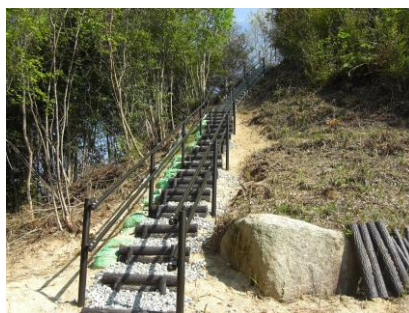
手すりがついた階段