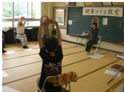
（小田地域センター）