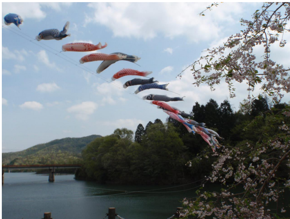
勇壮に泳ぐこいのぼり